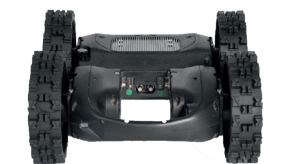
Nous intégrons votre propre équipement