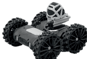
Détection de tirs