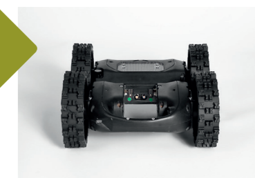
Modules d'extension 1-Clic