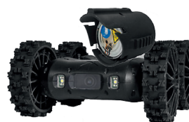
Générateur de fumée