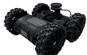
Eclairage ir 360°