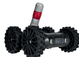
Armes à létalité réduite